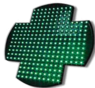
260 diodes vertes